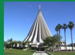
ARCIDIOCESI DI SIRACUSA

Associazione Culturale Regionale Amici del Presepio delle Madonne e di Sicilia Viale dell'Indipendenza, 100 - 96100 Siracusa (Siracusa) Tel. 0931/241211 - Fax 0931/241212 - Http://www.amicipresepisti.it e-mail: amicipresepisti@libero.it - amicipresepisti@comune.siracusa.it